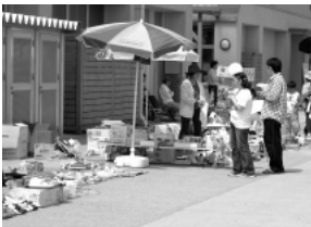
フリーマーケット出店!!