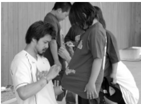
ヒートデビルズ選手によるサイン会