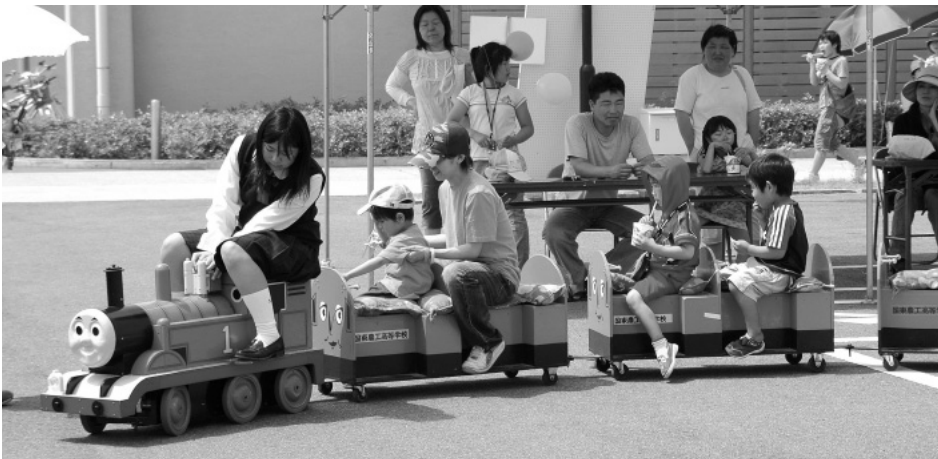
国東農工生徒による機関車トーマス君

平成19年7月20日【第5号】編集発行 大分県国東市武蔵町古市1086-1 社会福祉法人 国東市社会福祉協議会 TEL：0978-68-1976/FAX：0978-68-1677