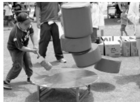
巨大だるま落としに挑戦!!