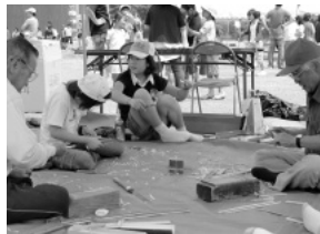
ボランティアによる竹細工教室