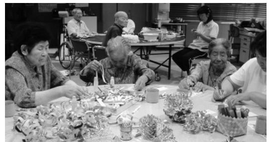
みなさんで七夕飾りを作成中

花見・誕生会・敬老会・運動会・クリスマス会など、季節に合わせた行事を行っています。