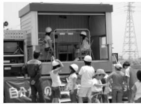
消防職員による災害体験教室