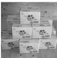
ユニバースフーズ(株)様からお菓子 200袋のご寄付をいただきました