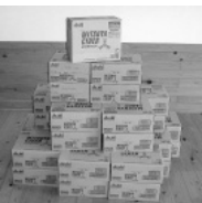
(株)ショッピングプラザエース様から ジュース810本のご寄付をいただきました