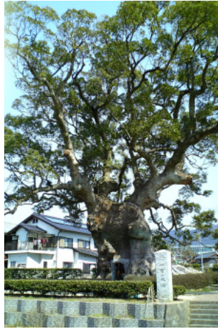
くすの大木全国第5位

平成十九年三月十九日(月)～二十日(火)に柳川・嬉野方面へ研修旅行に行きました。当日は肌寒く、柳川の川くだりは毛布が必要でしたが、船頭さんの歌声と丁寧な案内に川くだりを堪能しました。翌日は、佐賀のくすの大木を見学しました。十分に収穫のある研修でした。