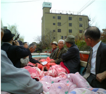
柳川の川くだりを楽しむ