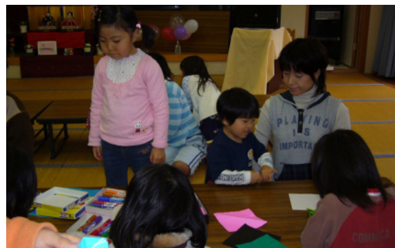
かわいいのができる？