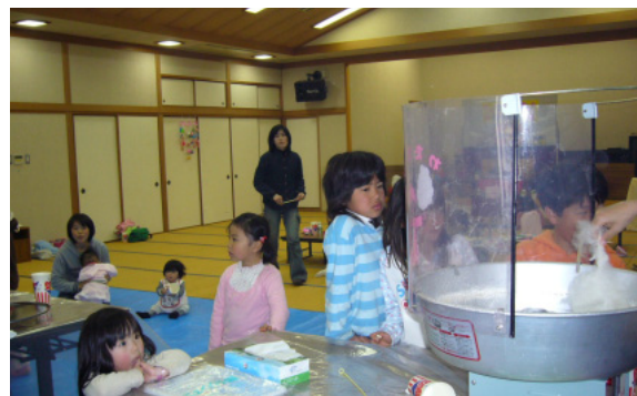
綿菓子できるかな？