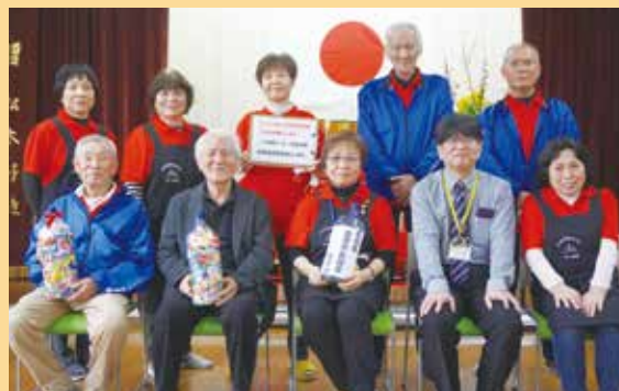
一村一心の会（豊崎地区）

安岐小学校児童会が中心となって「石川県の人たちに届けてください」という言葉とともに思いのこもった義援金を届けていただきました。