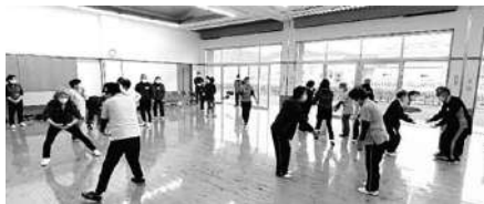
昨年度の養成講座(後期)2日目 レクリエーションの様子