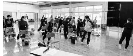
昨年度の養成講座(後期)3日目 体操実技の様子

地域を元気にする体操普及リーダーの養成を目的として開催(3日間)しています。昨年度までは年2回開催していましたが、今年度より年1回の開催となりました。