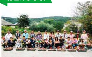
老人クラブの方々と芋掘