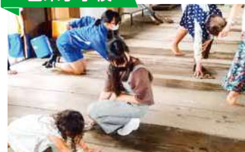
お宮のお堂清掃活動