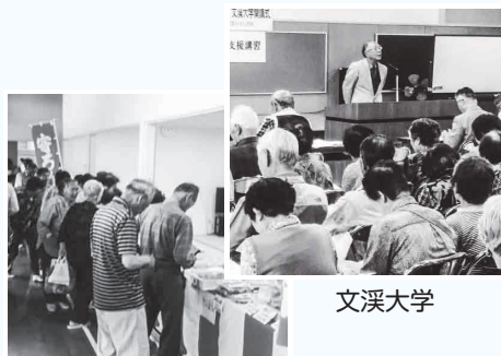
出張販売（買物支援）

“富来地区公民館”主催の高齢者学級“文溪大学”で、地元商店の出張販売を実施しています（概ね月1回）。惣菜やお弁当が購入でき高齢者の方に大変喜ばれています。富来地区での買物支援を考える一つのきっかけになりました。（コロナ禍のため、令和2～3年度は自粛中）