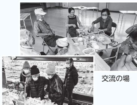
町内商店（買物支援）

“松原区”で、区有志の方々が中心となって、誰でも気軽に立ち寄れる居場所として区の公民館に立ち上げたカフェが、高齢者の方々の交流の場になっています。令和3年5月からは新たに買物外出支援・送迎支援の取り組みに広がりました。（※開所日時：火・水曜日 9～11時）