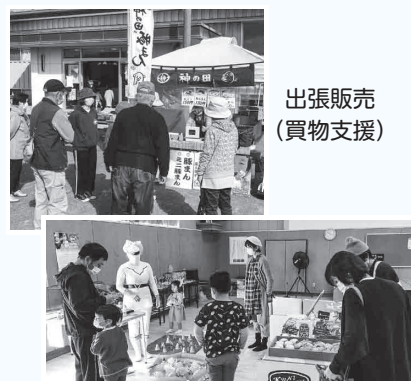
各種イベント・手芸体験

“富来地区公民館”で地区有志の方々が「富来地区の活性化の一助になれば」とマルシェ（フリーマーケット）を企画開催しました。高齢者の方が楽しめるイベントだけでなく、若い親子世代にも楽しめる内容となっており、大変好評で多世代交流にもつながりました。富来地区での地域づくり・高齢者支援を考える一つのきっかけになりました。ぜひ一度、マルシェにお越しください。（マルシェ開催予定月：7月、11月、3月 年3回）