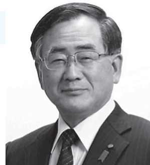
国東市社会福祉協議会