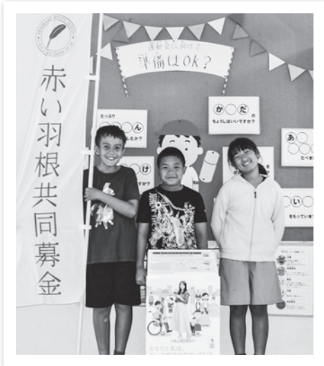
今年も学校募金に取り組む 竹田津小学校 児童会の皆さん

10月1日から“じぶんの町を良くするしくみ”をテーマに、今年も「赤い羽根共同募金運動」「歳末たすけあい募金運動」がスタートしました。この運動は、毎年10月1日から12月31日までの間に全国一斉に行われます。