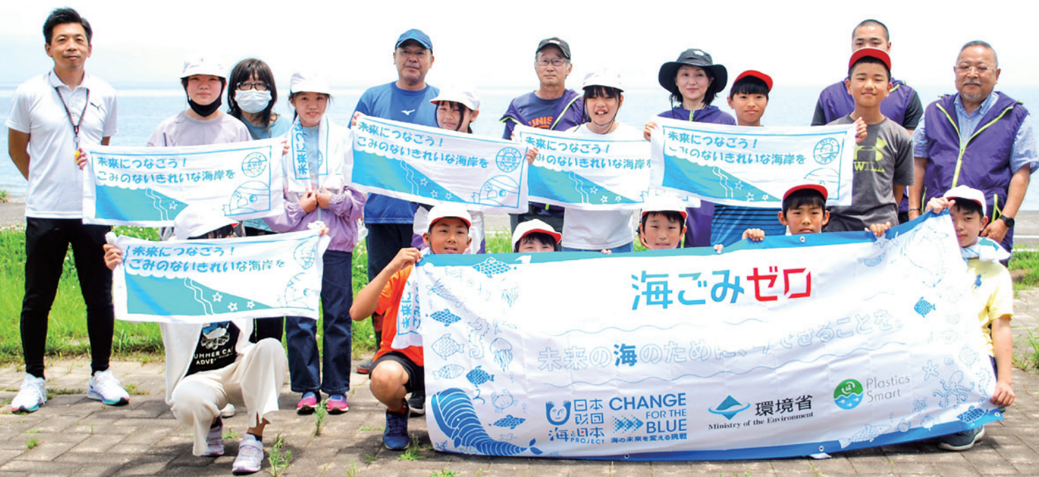
NPO法人国東市手と手とまちづくりたいのみなさんと 富来小学校6年生児童 ※国東町富来浦 羽田海岸にて