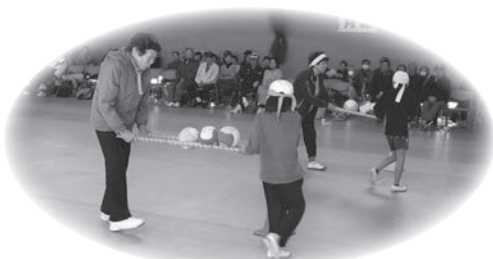
安岐地区：小学生等協力競技☆