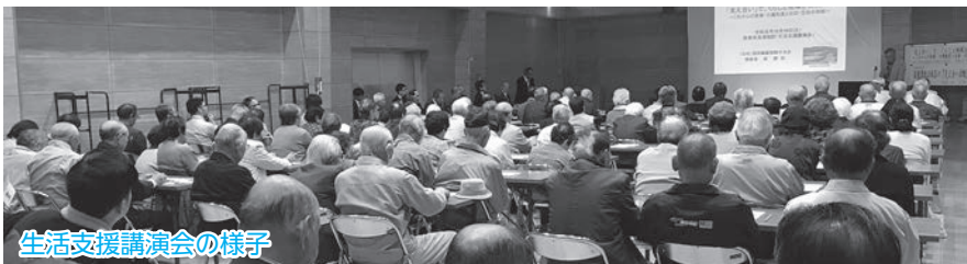
生活支援講演会の様子

講演後の【アンケート】では、ありがたいことに《82名の方の回答》を頂き、その91%の方々が、『住民同士の支え合いの仕組みづくり』が必要と感じられており、「活動に参加したい」と思われている方が、38%もおられ、大変心強く感じております。今後の方向性として、【地域の皆様のニーズを基に、運動・話し相手・食事・買い物支援 等】の支援活動誕生に向け、話し合いの歩を進める予定です。