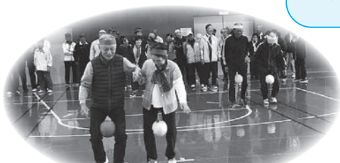
国見地区：歩く姿はペンギン