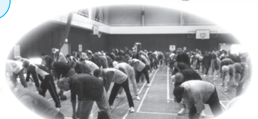
♪みんなで準備体操♪1.2.3.4♪