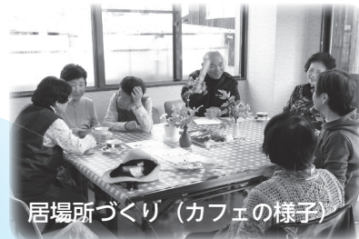
居場所づくり（カフェの様子）

皆さんが感じている不便や不安に対し、必要な支援等を知るために、全戸訪問による聞き取り調査を実施。