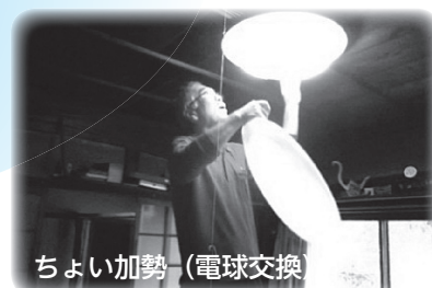
ちよい加勢（電球交換）

送迎も利用しながら皆さんで楽しく食事。 いつもより多く食べれた♪の声も。 孤食を防止し、栄養改善の啓発。