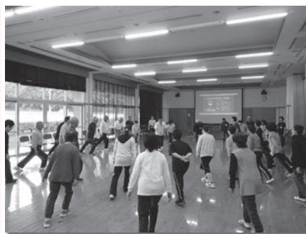
昨年の養成講座の様子