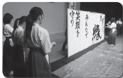
国東高校書道部による書道パフォーマンス。