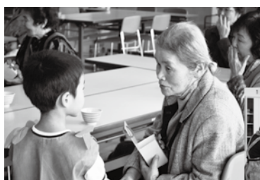
一人暮らし高齢者のつどい