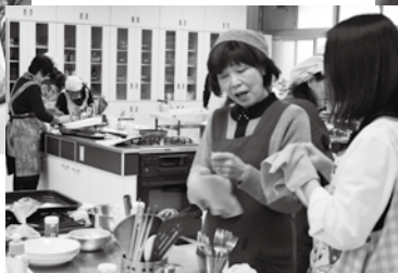
市母子寡婦福祉会 料理教室