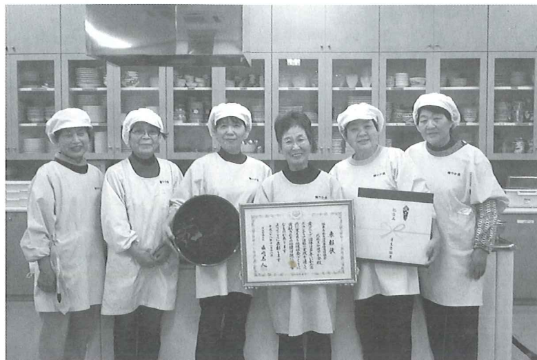
(国東市食生活改善推進協議会武蔵支部健やか会)

国東市食生活改善推進協議会武蔵支部健やか会は、国東市ボランティア・市民活動センター(ボランティアセンター)の登録団体です。ボランティアセンターは、ボランティア活動をしたい人とボランティア活動に来てほしい人を繋げる働きを持ち、国東市社協内に設置しています。