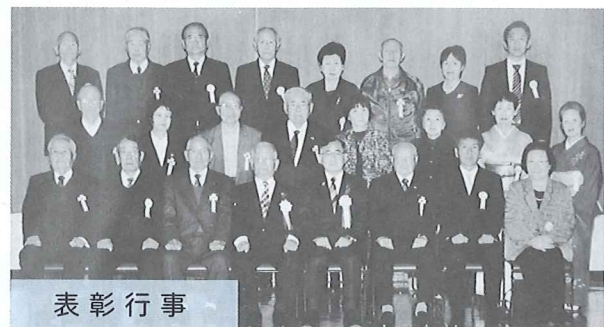
表彰行事 各分野の福祉事業にご尽力された個人・団体の皆さまに対し、表彰状・感謝状が贈られました。※受賞者は以下のとおり