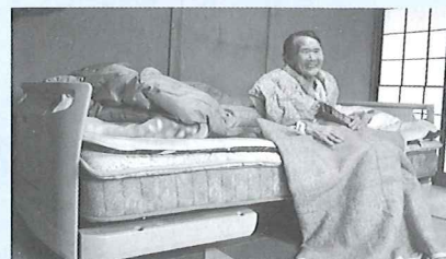
ベッドを設置した際の利用者さまの笑顔。こんなところに幸せを感じる社会福祉協議会です。