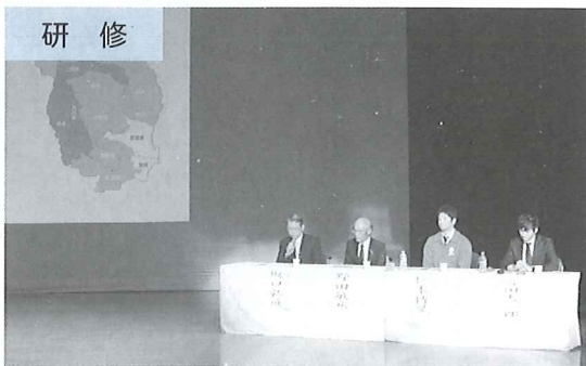
研修 国見町竹田津地区、国東町上国崎地区より協働の地域づくりの現状を発表していただきました。また、臼杵市の老人クラブ清流会より地域ぐるみで高齢者を支えあうボランティア活動の先進的な取り組みをご紹介していただきました。