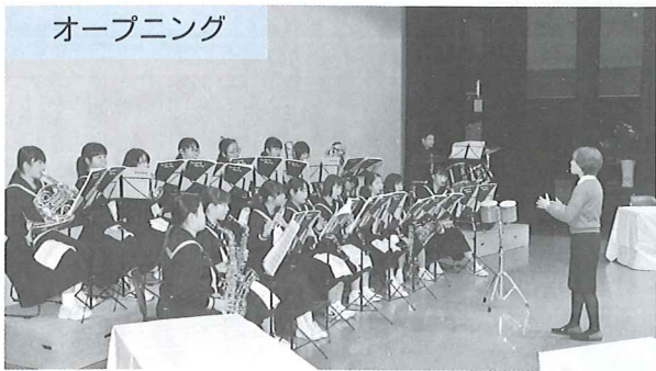
オープニング 会のオープニングでは、安岐中学校吹奏楽部の皆さんに、合併10周年記念大会を飾る素晴らしい演奏を披露していただきました。

◆ これからの地域づくりを進めていく上で、実り多い研修となったのではないだろうか。