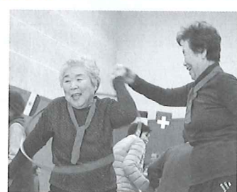
国見B & G体育館