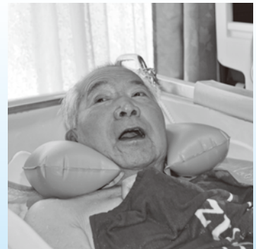
取材へのご協力 ありがとうございました!!

そんなお二人の二人三脚を「訪問入浴サービス」を通じて、今まで以上に支えていきたいと思っております。