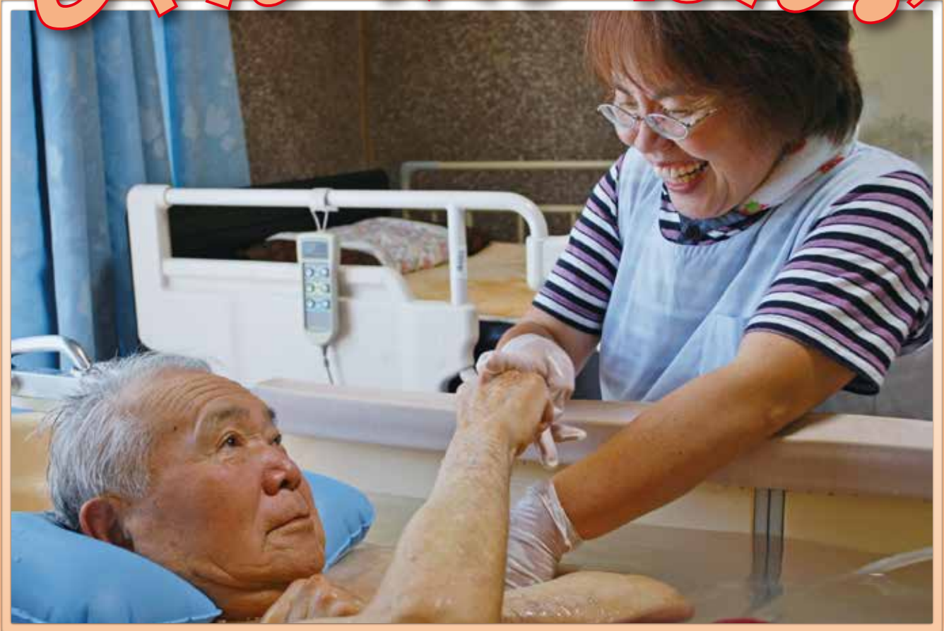
【写真】訪問入浴サービスでスタッフと「じゃんけん」をする利用者さん。(詳細は4ページ)