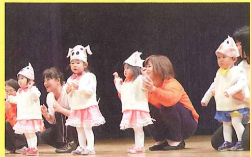
写真は昨年度のアトラクションの様子