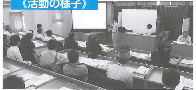
5/25 市長さんをお交えての勉強会（地域づくりについて） （行政機関で地域づくりを行っている担当者をつなげる場）