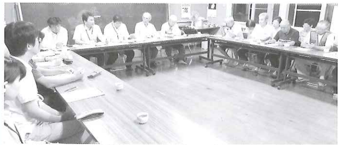
8/27 上国崎地区（国東町）の方との意見交換会 （地域づくり関係者と連携して地域を訪問）