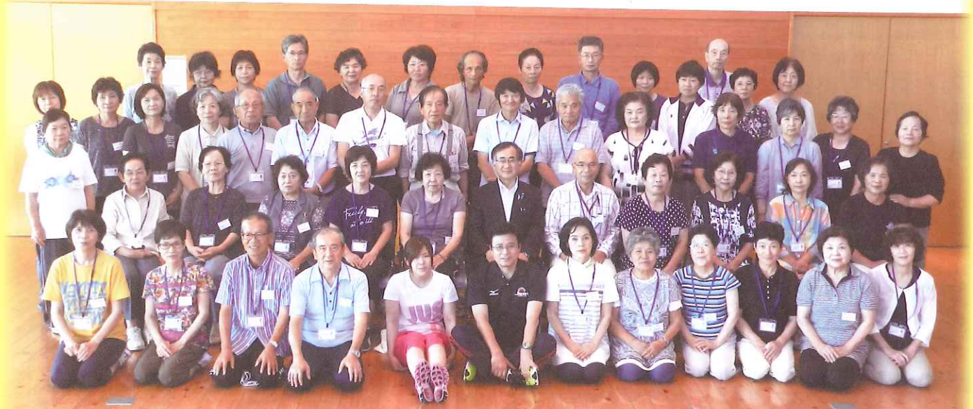
【写真】 国東市一般介護予防事業『週一元気アップ教室』 さ吉くんで元気体操普及リーダー養成講座 受講生

『週一元気アップ教室』は、誰にでも取り組みやすい体操（めじろん元気アップ体操）を、毎週同じ時間・同じ場所で行う住民主体の体操教室です。体操普及リーダーは、体操を通じて地域を元気にする人たちです。あなたの地区にリーダーさんはいますか？