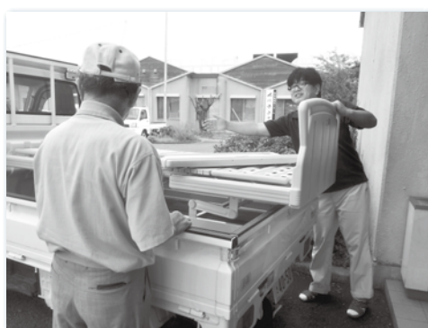
↑搬入搬出は原則申請者が行いますが、一人暮らし高齢者の方等世帯の状況に応じて持運び等行っています。