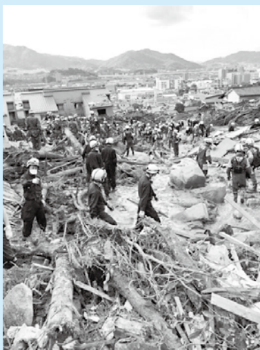
↑広島県大雨災害の現場