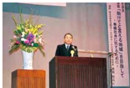
※写真は昨年度の記念講演の様子

※国東市老人クラブ連合会主催行事「高齢者大学地方リーダー研修会」も同時開催予定です。