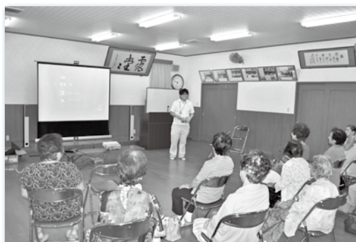
↑「菊永サロン横手」(国東町)より映画鑑賞をしたいと依頼があったため、機材を持っておじゃましました。