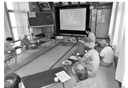
↑地域福祉活動への支援（地域福祉事業）