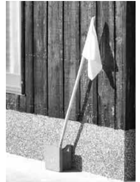
↑黄色い旗運動の推進 （地域福祉事業）