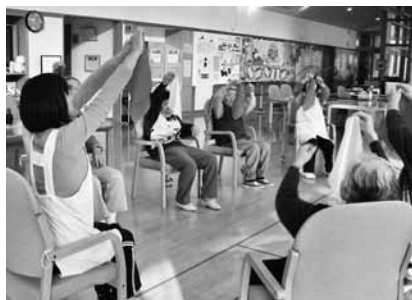
↑国東市さかしなろう会 介護予防推進事業（市）（受託事業）