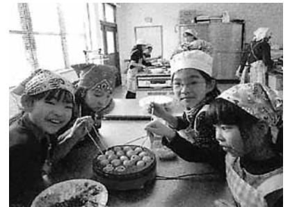
↑放課後児童健全育成事業（市） （受託事業）