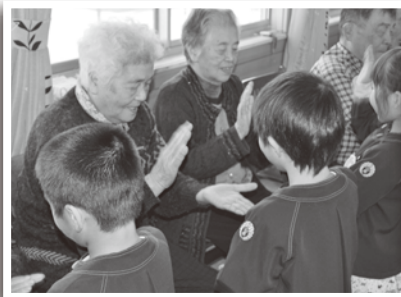
◀ 高齢者と園児の交流

現在、核家族化の進行等で高齢者と子どもたちの 触れ合う機会が減っていることからなずな会では今 後も高齢者と子どもの交流会を行うことを計画して います。