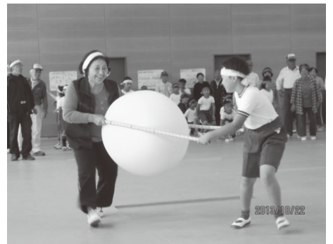
▲【安岐会場】 10月22日(火) ボールを上手にはさんで落とさない ようにチームワークで進みます。