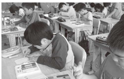
▲ 『元気が出るお手紙』を作成中です。