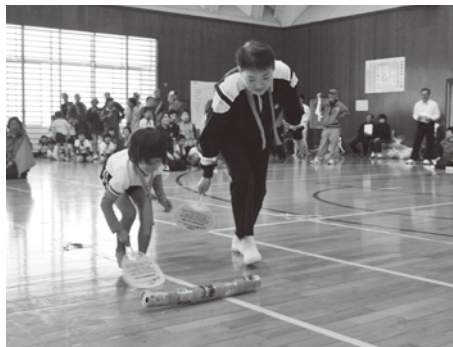
▲【武蔵会場】 10月29日(火) 空缶がまっすぐ進むようにお互いに 呼吸を合わせます。

10月～11月にかけて 福祉ふれあいスポーツ大 会が開催され、地域住民 の方、児童等に参加して いただき、スポーツを通し て交流を深めました。