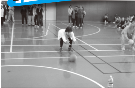
▲【国見会場】 10月30日(水) ボールをうまくピンに当てることができるでしょうか？