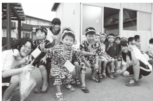
▲ 学校をはじめ、地域を中心に活動しています。