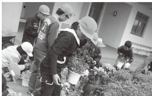
▲ きれいな花を届けられるように頑張っています。