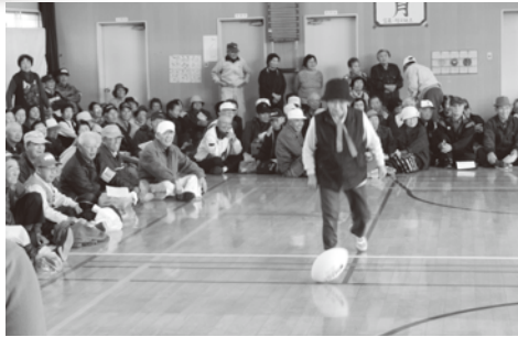
▲【国東会場】 11月12日(火) ラグビーボールをけりながらリレーしますが、 ボールをまっすぐ進めるのが大変です。