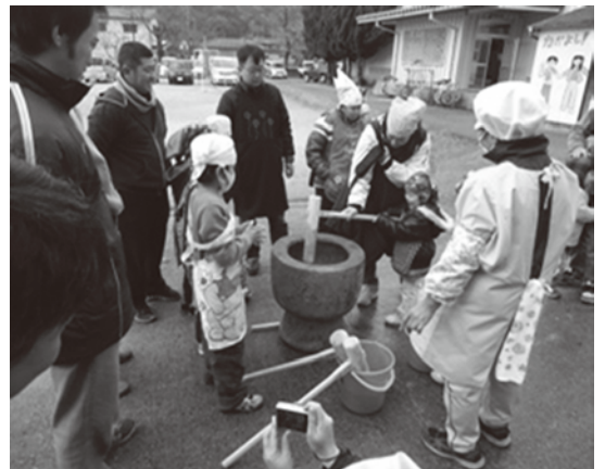
▲親子餅つき大会の様子