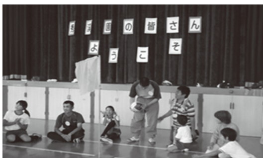
▲「秀溪園」とのふれあい交流会