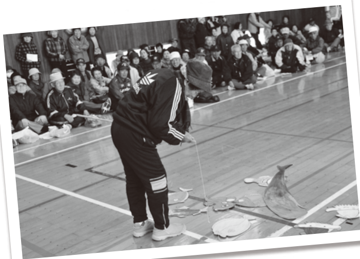
△なかなか、難しい魚釣りに挑戦です。

天候もよく、当初予想を超える約400名の方にご参加いただきました。昼食に国東市母子寡婦福祉会国東支部の方に豚汁を振る舞っていただきました。