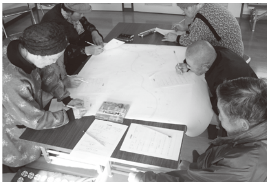
△ご近所マップ作成の様子

支援内容はサロン活動のプログラムに対する提案や、レクリエーション用具の貸出等を行っています。用具は自主的に借りて使うこともできますが、使い方が分からない時は職員がお伺いすることもできます（事前にご連絡ください）。