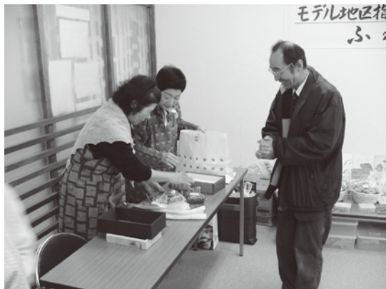
△開店準備を行うスタッフの方々

1月27日（日）南安岐地区公民館内にて、地区社協事業として「ふれあい100円市場」を開催いたしました。この日は、向陽祭とタイアップして初めての開催でした。開催当初は天候も悪く寒かったため、「多くの方が来てくれるだろうか」と不安を抱きました。市場では地元の有志の方々による野菜や果物等の農産物、自家製まんじゅう、クッキー、小物、食品等色々なものを販売しましたが、子どもたちを始め、多くの方にご来場いただき、販売物が品切れになるほどの大盛況となりました。今回の行事で地域との交流やふれあいが一段と深まったことと思います。出品者の皆様、ご協力ありがとうございました。