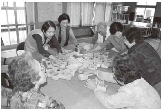
△レクリエーション用具等の貸出 (サロン活動ではお馴染みとなった コミュニケーション麻雀)

地域の高齢者や障がい者・児、子育て中の方等が、生きがいと元気に暮らすきっかけを見つけ、地域の人同士のつながりを深める場であるサロン活動を支援しています。