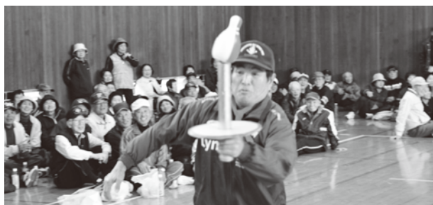
△シンプルですが、難易度が高い競技です。 (ラップの芯の上に柔らかいボウリングのピンを載せ、バランスを取りながら一周します)

天候もよく、当初予想を超える約400名の方にご参加いただきました。昼食に国東市母子寡婦福祉会国東支部の方に豚汁を振る舞っていただきました。