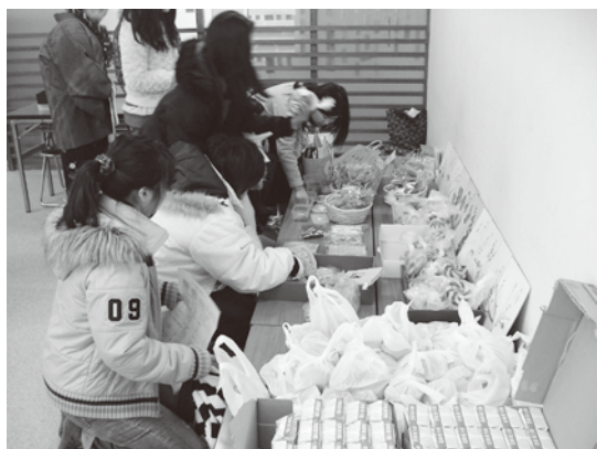
△多くの品物が販売されました。

1月27日（日）南安岐地区公民館内にて、地区社協事業として「ふれあい100円市場」を開催いたしました。この日は、向陽祭とタイアップして初めての開催でした。開催当初は天候も悪く寒かったため、「多くの方が来てくれるだろうか」と不安を抱きました。市場では地元の有志の方々による野菜や果物等の農産物、自家製まんじゅう、クッキー、小物、食品等色々なものを販売しましたが、子どもたちを始め、多くの方にご来場いただき、販売物が品切れになるほどの大盛況となりました。今回の行事で地域との交流やふれあいが一段と深まったことと思います。出品者の皆様、ご協力ありがとうございました。