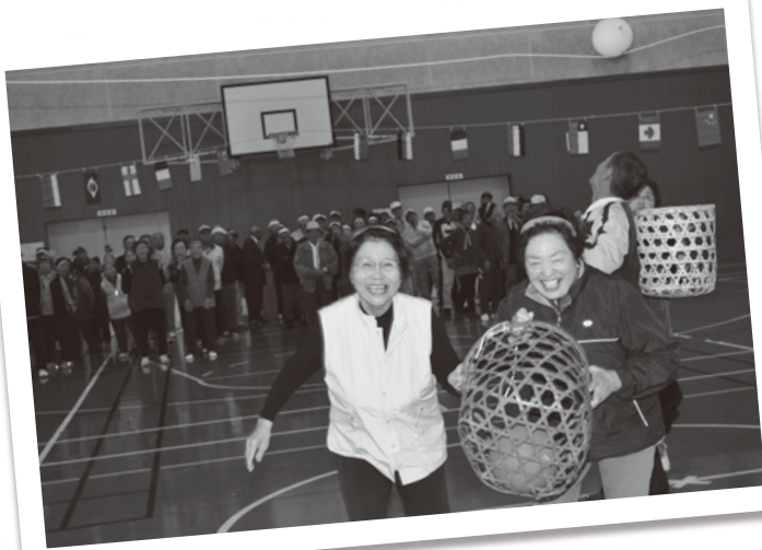
△ゴールに向かって猛ダッシュ! (背中に背負ったカゴでボールをキャッチします。)

約180名の方に参加していただきました。伊美保育園の園児の皆さんも競技に参加しました。