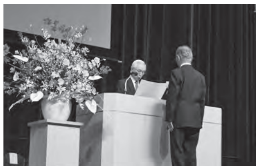
各部門の代表者に賞状及び記念品が手渡されました。

10月25日(火)、別府市のビーコンプラザで第6回大分県地域福祉推進大会が開催されました。だれもが安心して心豊かに暮らせる社会の実現のために開催されている本大会では地域福祉の推進に貢献された団体・個人へ表彰状並びに感謝状が贈られました。今回国東市で受賞されたのは次のとおりです。おめでとうございます。