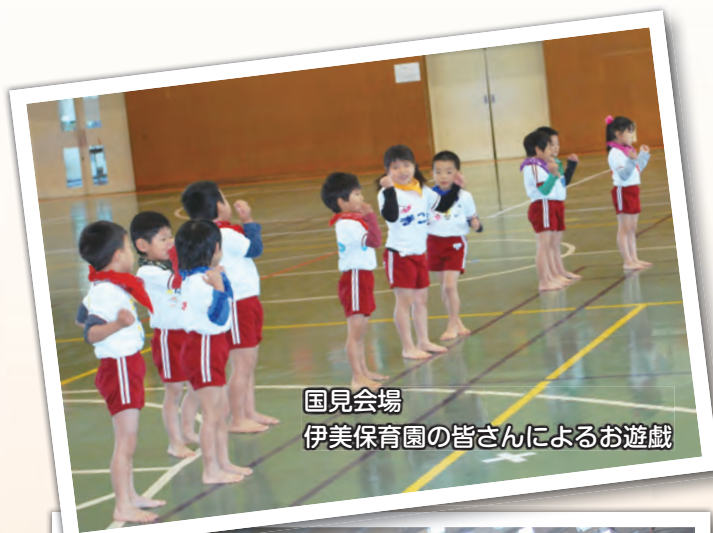
国見会場 伊美保育園の皆さんによるお遊戯