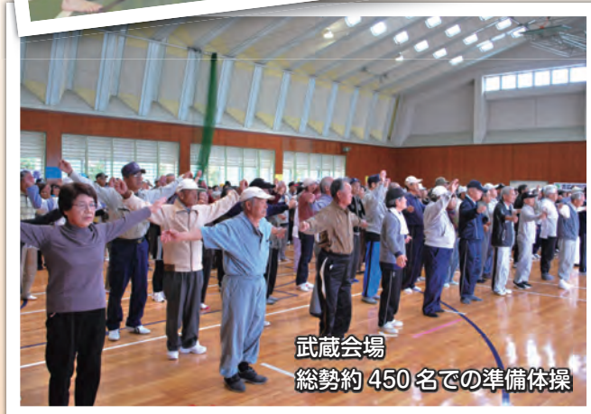
武蔵会場 総勢約450名での準備体操