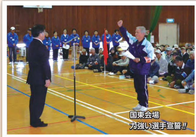
国東会場 力強い選手宣誓!!