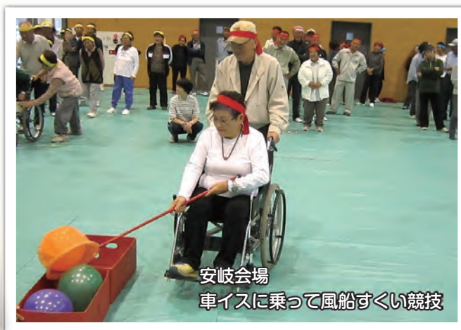
安岐会場 車イスに乗って風船すくい競技