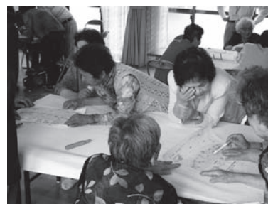
いろいろな情報を地図に書き込みます。 上国崎地区公民館(国東町見地)での訓練

その後、地図に書き込む作業をはじめます。実際の訓練の様子を見ると参加される方の多くは地域の避難場所や危険区域を把握していますが、資料(地図)を通して見ることでより客観的な判断ができ、生活に身近な問題なので話し合いも活発にされているようです。