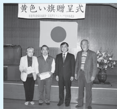
国東町上治郎丸区での贈呈式