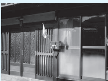
「今日も元気に過ごしています」

国東市内のあちこちに掲げられている黄色い旗。地域の安否確認運動として知られている黄色い旗運動が7月よりACジャパンのCMで放映されています。更に多くの方が知ることになった黄色い旗運動について改めてご紹介します。