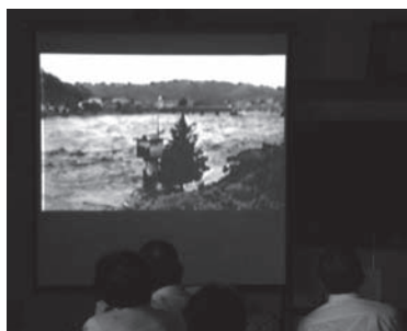
改めて自然の猛威を思い知らされます

東日本大震災発生以降、防災に対する意識は高まっています。 地域防災力の向上を目的として現在広がりつつある訓練の様子をお届けします。