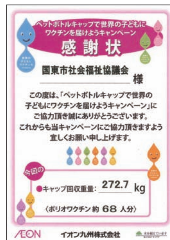
イオン九州(株)からの感謝状

*国東市社会福祉協議会にお持ちいただく場合は、キャップについたシールをはがし、軽くすすいでからお持ちください。