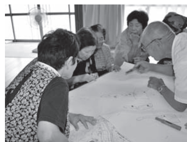
緊急時の対応を話し合います。 手野公民館(武蔵町手野)での訓練

災害図上訓練は現在サロン活動など地域の行事等で実施しています。興味のある方、実施してみたい方は国東市社会福祉協議会(連絡先6☎参照)までご連絡ください。