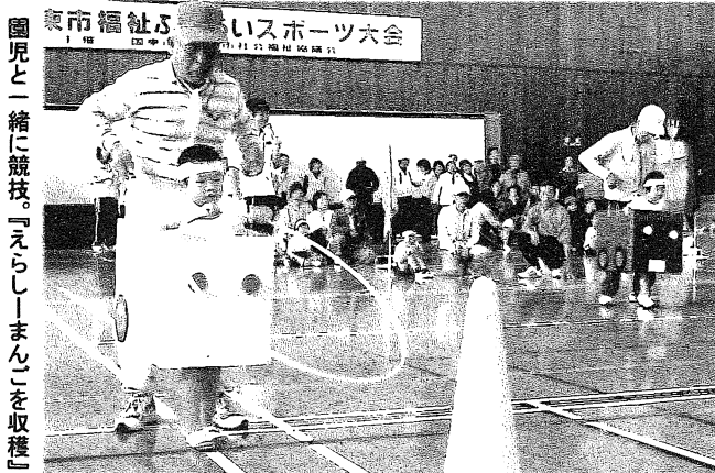
国見と一緒に競技。『えらしーまん』を収穫

十月十五日(木)、国東体育館にて開催し、約三百四十名が集まりました。競技には、旭日幼稚園、豊崎幼稚園、富来幼稚園の園児や民生委員さんも参加しました。 上の写真の「えらしーまん」を収穫という競技では、地域の方と園児が一緒に手作りのダンボールの車に乗って、フラフープの輪をコーンへ通して戻ってきます。 表情豊かでもとてもかわいい園児の姿に皆さん笑顔で競技に参加していました。