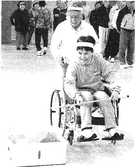
車イスを上手にやさしく動かしてね。『よろうち行こうえ』

十月十四日(水)、安岐中央小学校体育館にて開催し、約二百名が集まりました。競技には、安岐中央幼稚園の園児や民生委員さんも参加しました。