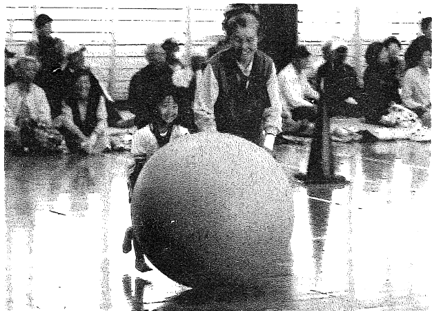
二人で力を合わせて転がそう。『大玉転がし』

福祉ふれあいスポーツ大会は、終始大きな歓声と笑い声に包まれ、参加された方にとって地域のふれあいの場となったことでしょう。