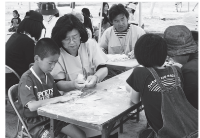
弥生のムラによる勾玉づくり教室