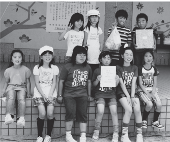
ドッジビー大会 優勝「安岐なかよし」チーム