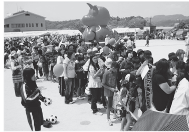
トリニータ選手サイン会に長蛇の列