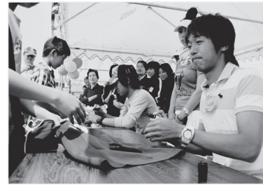
トリニータ選手サイン会