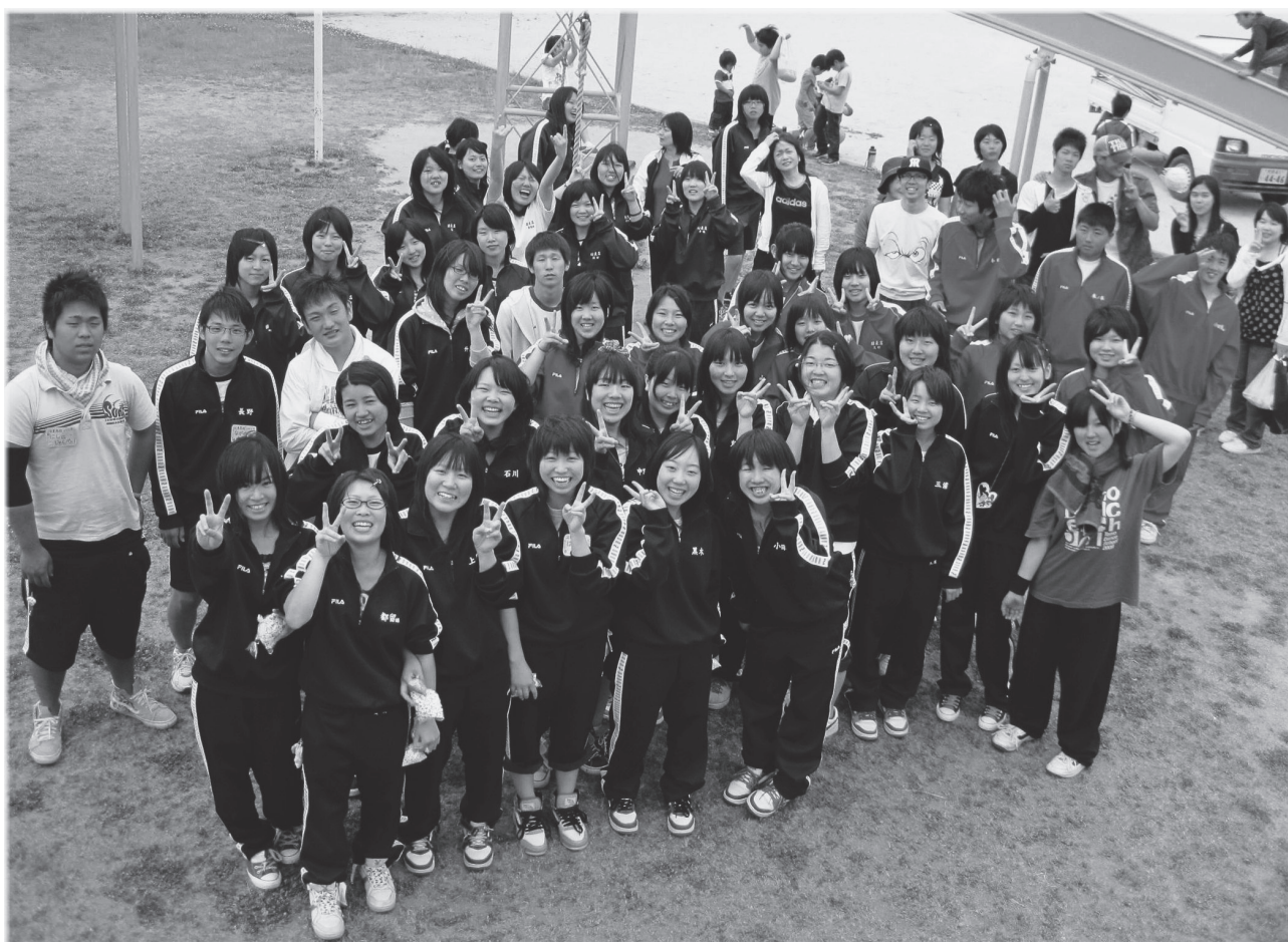
(写真：第4回国東市こどもまつり ボランティアスタッフのみなさん) ※第4回国東市こどもまつりの内容については、5ページをご覧ください。

平成21年7月21日【第13号】編集発行 大分県国東市武蔵町古市1086番地1 社会福祉法人 国東市社会福祉協議会 TEL：0978-68-1976 / FAX：0978-68-1677