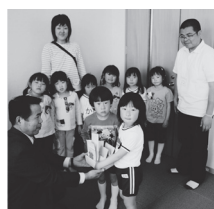
むさしこども園様より花祭りで寄せられた浄財の寄付をいただきました。ありがとうございます。