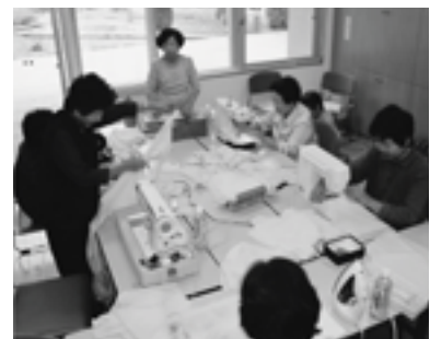
黄色い旗製作の様子

この『黄色い旗運動』のように誰もが住み慣れた地域でこれか ら安心して暮らすことができるように、お互いが助け合い支え あえる地域づくりを進めていきましょう。