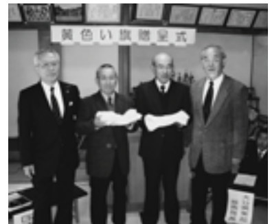
黄色い旗贈呈式の様子