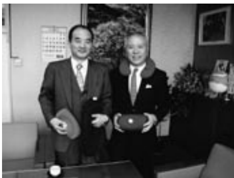
ヘルメット潜水(株)様から湯たんぼ120個の御寄付をいただきました。